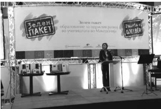
Промоција на “Зелен Пакет”

Промоцијата беше организирана во два одделни настани - дневен и ноќен промотивен настан. Дневната промоција беше одржана на еден многу убав и сончев есенски ден во главниот град на Плоштадот “Македонија“, на 8ми октомври 2008 год., со посебна детска програма. Тоа беше настан слободен за учество и училиштата беа поканети да земат учество. Млад водител познат во јавноста беше ангажиран да го води на настанот. Ученици од основното училиште “Гоце Делчев“ од Скопје изведоа претстава “Зелениот пакет во училиштата“ специјално напишана за оваа пригода. Децата и останатите граѓани имаа можност да ги слушнат најмладите учесници - детскиот хор “Поточиња“ со нивната специјална изведба на неколку песнички за животната средина. Некои од учениците учествуваа во наградна игра и за нивното активно учество добија награди - дипломи од Зелен Пакет и посебни маички специјално изработени со овој проект со логото на Зелениот Пакет. ЦД-РОМ од од Зелениот Пакет беше дистрибуиран за сите граѓани. Промотивниот настан заврши со песни и пораки упатени до младите и децата за важноста на животната средина и нејзината заштита. Многу печатени и електронски медиуми го најавија настанот во Скопје, нагласувајќи ги напорите на РЕЦ и двете Министерство во насока на образование за одржлив развој во Македонија.