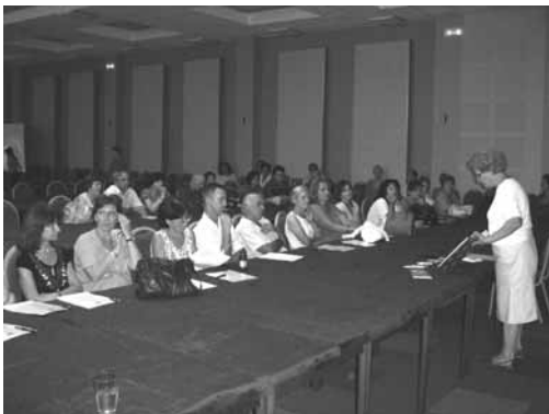
Од обуката одржана во Охрид

За таа цел беше обучена посебна група на обучувачи во која учествуваа советници од Бирото за развој на образованието, наставници од основни и средни училишта и претставници на Граѓански здруженија. Обуките се одржаа во периодот од 20-27 август 2008 год. и тие имаа за цел да им објаснат на наставниците како да го користат Зелениот пакет, кој според новата наставна програма на Бирото за развој на образованието е препорачан за употреба во сите училишта со почетокот на учебната 2008-2009 година, првенствено во изборниот наставен предмет во шесто одделение, Воспитание за околината, како и предметите биологија,