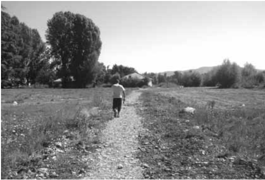
Патеката пред почеток на изградбата