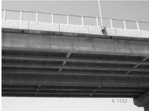
Поглед на долниот дел на патот

Изготвување на Планот за управување со животната средина и Планот за управување со загадувањето од инциденти за оперативниот период: Финалните драфт документи за оперативниот период - Планот за управување со животната средина (ОПУЖС) и Планот за управување со загадување од инциденти (ОПУИЗ) се подготвени. Истите се дистрибуирани до