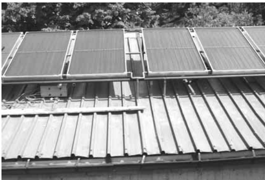
Сончев колектор на кровот на детска градинка “Раде Јовчевски-Корчагин”- Скопје