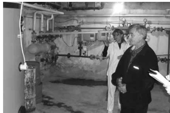
Внатрешна инсталација на колекторот

- Извиднички Одред “Крсте Јон” Струга - Користење на природата за развој на туризмот”.