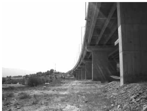
Дел од обиколницата

Советодавната група за животна средина и мониторинг за Скопската Обиколница (ЕМАГ) го одржа својот дванаесетти квартален состанок и инспекција на терен во периодот од 4-5 септември, 2008 год. ЕМАГ го проценува спроведувањето и ефикасноста на мерките за намалување на влијанието врз животната средина и мониторингот од изградбата на западната секција од проектот Скопска Обиколница Фаза 2, финансиран од Европската Банка за Обнова и Развој (ЕБРД). Како што е наведено во договорот за заем на Фондот за Магистрални и Регионални Патишта (ФМРП) и ЕБРД, овие мерки мора да бидат применети од Изведувачот на градежните работи ТЕРНА и Надзорот ГИМ, како барање на нивниот договор со ФМРП. ЕМАГ беше формирана во 2005 год. Од страна на Министерството за транспорт и врски (МТВ). ЕМАГ ги претставува локалните заедници по должина на обиколницата НВО од областа на животната средина