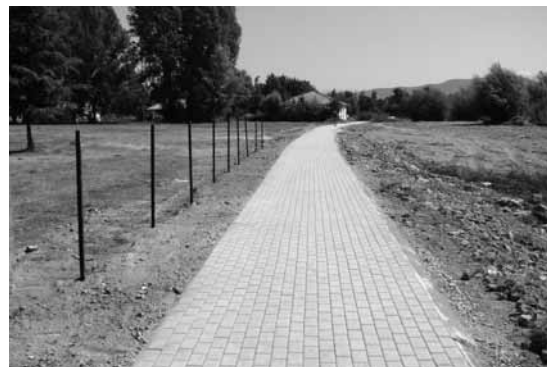
Патеката по изградбата

Во досегашното спроведување на проектот беше изградена пешачка патека во должина од околу 200 м, а беше расчистена и узурпирана површина од околу 10000 м 2 . Беа изработени две дрвени табли за промовирање на важноста на крајбрежниот појас (ќе бидат поставени во почетокот на мај 2009 година).