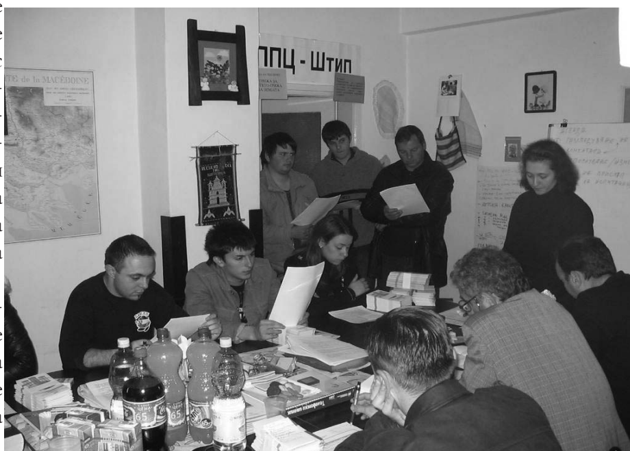
Обука за анкетарите за испитување на јавното мислење во Штип