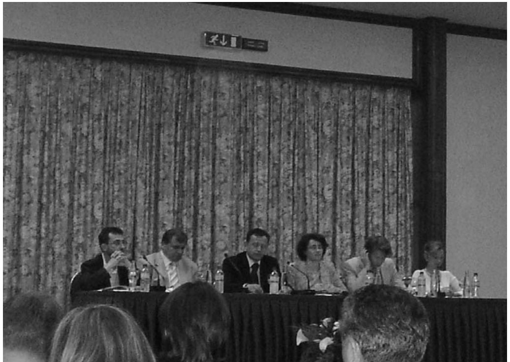
Промоција на ЛЕАПот на Општина Илинден

Шведската агенција за меѓународен развој и соработка (Sida) го одобри финансирањето на првиот приоритет.