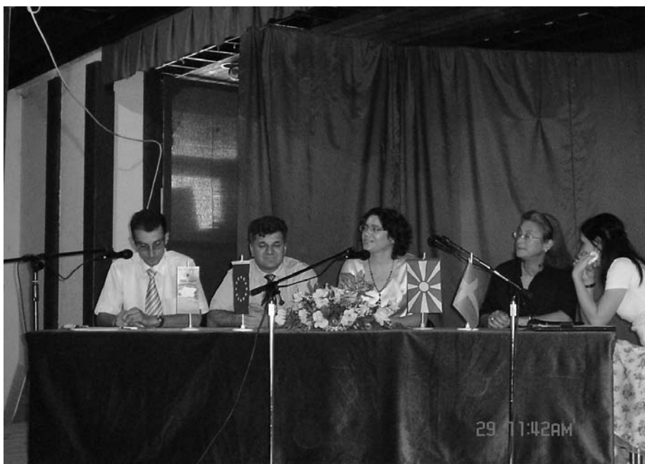
Промоција на ЛЕАПот на Општина Виноца

Поддржан е проектот Нерегулирано речно корито и излевање на Градечка река. По склучување на Договорот за соработка и по соодветната процедура според законот за јавни набавки на Република Македонија, се отпочна со спроведување на проектните активности,