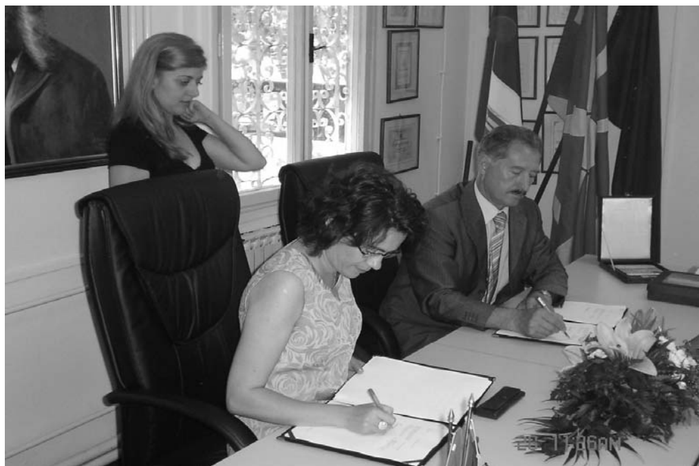
Потпишување на Договорот за имплементација на втората фаза од грант донацијата на РЕЦ за изградба на колекторскиот систем во дел од населените места во Општина Ѓорче Петров

Со потпишување на Договорот за соработка помеѓу Канцеларијата на РЕЦ во Македонија и општината, а со помош на овој имплементационен фонд, се отпочна изградбата дел од колекторски систем во населеното место Волково Ново Село, каде ќе се прибираат отпадните води од с.Орман и с.Волково со населбите Кисела Јабука и Стопански Двор. Изградбата започна на 25.09.2006.