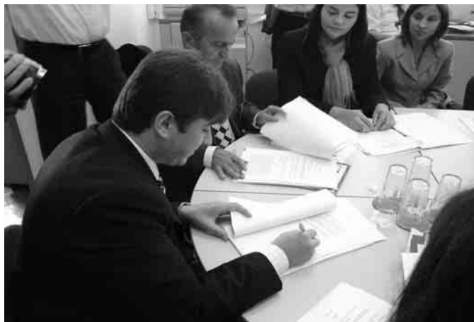
Потпишување на Меморандумот за Соработка помеѓу Градоначалниците на Општина Дебар и Општина Пешкопеја