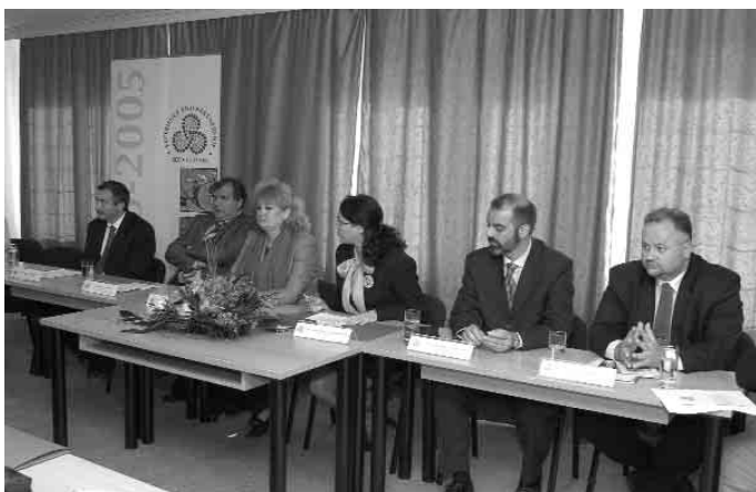
Прес конференција за новинарите, на која зборуваа Извршниот Директор на РЕЦ, Министерот за животна средина и просторно планирање како и Директорите на локалните Канцеларии на РЕЦ во Македонија, Албанија, Босна и Херцеговина, Србија и Црна Гора и Хрватска.