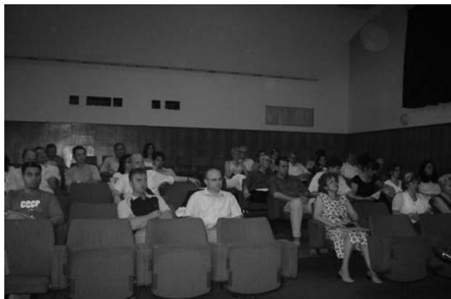
Од средбата одржана во Скопје, јуни 2003