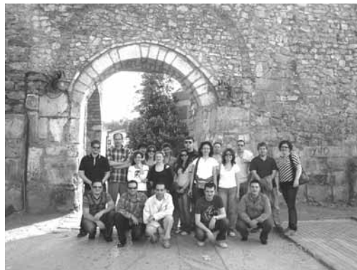
Учесници на обуката

Секој модул траеше 1 ден. Учесниците ги споделија своите искуства и добија сертификат за завршена обука. Бидејќи програмата става акцент и на теоретското и на практичното учење, опфати по двајца поедници од секоја организација.