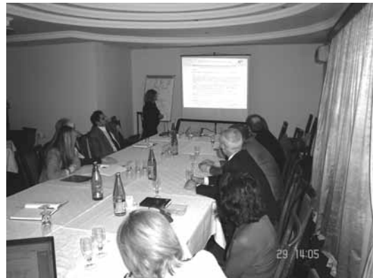
Од регионалната средба одржана во Струмица

Стратегијата е во завршна фаза и веќе се утврдени проектите што оптимално би можеле да се спроведат во периодот 2009-2013 година. Исто така со Стратегијата се предлага зајакнување на службите што се вклучени во процесот на подготвување на проекти и нивно спроведување. Институционалниот модел сеуште се договара, бидејќи проектниот тим предлага воспоставување на сосема ново тело кое ќе ги координира надлежните министерства. Долгорочно ова тело би можело да се трансформира во Агенција што би била одговорна за спроведување на проекти финансирани од страна на структурните и кохезионите фондови, кога Македонија би станала полноправна членка на ЕУ.