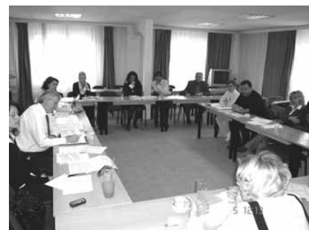
11 ТИ состанок на ЕМАГ

Следниот состанок на ЕМАГ е прелиминарно закажан за периодот од 3-4 септември 2008 год.