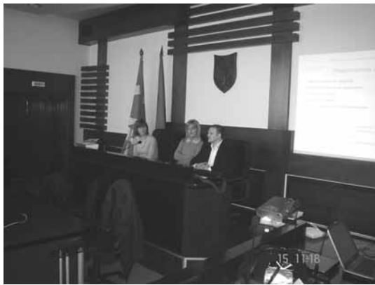
Од регионалната средба одржана во Велес

Во изминатиот период проектниот тим имаше интензивна комуникација со надлежните служби на министерствата кои што се вклучени во спроведувањето на инвестиции во животната средина. Средбите делумно се одвиваа формално, преку одржување на состаноците на Единицата за координирање на проектот, а исто така се организираа неформални средби, пред се со Министерствата за животна средина и просторно планирање, финансии и транспорт и врски. Истовремено, се организираа 8 регионални средби со општините во Скопје, Куманово, Тетово, Прилеп, Штип, Охрид, Струмица и Велес. Истите беа организирани како работилници на кои учествуваа припадните општини од планско-развојните региони кои се воспоставени согласно Законот за рамномерен регионален развој. Целта на работилниците беше да се запознаат општините со тековните и планираните активности во рамките на проектот и да се надолжат листите на инвестициони проекти идентификувани на национално ниво со проекти од локално значење. Резултатите од одржаните работилници беа мошне интересни. Уште еднаш се потврди дека органите на извршната власт при подготвувањето на програмите за инвестирање во животната средина