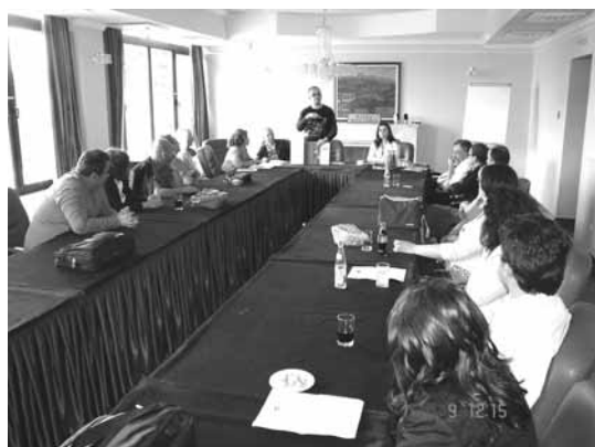
Охрид 9-10 јуни обука за обучувачи

Проектот ќе трае до крајот на септември, 2008г. Директни корисници на проектот се Министерството за животна средина и просторно планирање и Министерството за образование и наука во Република Македонија а имплементирачка агенција на проектот е Регионалниот центар за заштита на животна средина за Централна и Источна Европа (РЕЦ) - Канцеларија во Македонија. Донатор на проектот е Австриската Влада преку Austrian Development Cooperation.