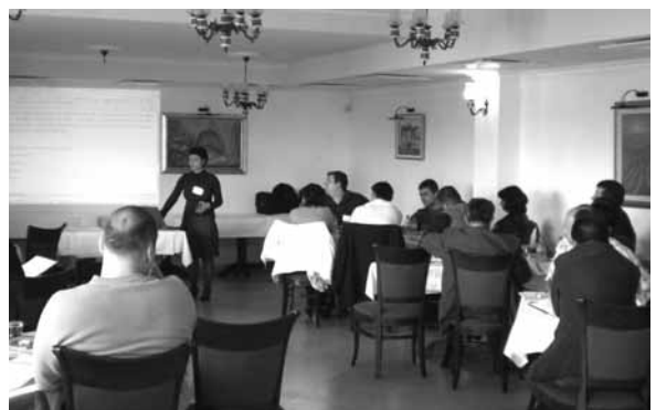
Обука за 36 претставници од 6 те општини

Првиот семинар “Почейни активности за изработка на ЛЕАП” се одржа во хотелот “Инекс Горица” во Охрид, од 06 - 09 Мај 2008 год. На семинарот присуствуваа по 6 претставници од селектираните општини. Семинарот беше искористен за запознавање на претставниците на општините со активностите кои секоја општина треба да ги превземе заради започнување на изработката на ЛЕАП. При тоа беа дискутирани следните теми: Формирање на организациска структура за