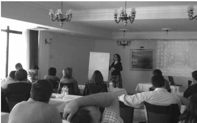
Сесија: оцена на состојбите во животната средина

изработка на ЛЕАП, изработка на проценка на состојбата со животната средина во општината и изработка на план за вклучување на јавноста во процесот на изработка на ЛЕАП. По завршување на семинарот, секоја од општините треба да ги реализира подготвителните активности за изработка на ЛЕАП.