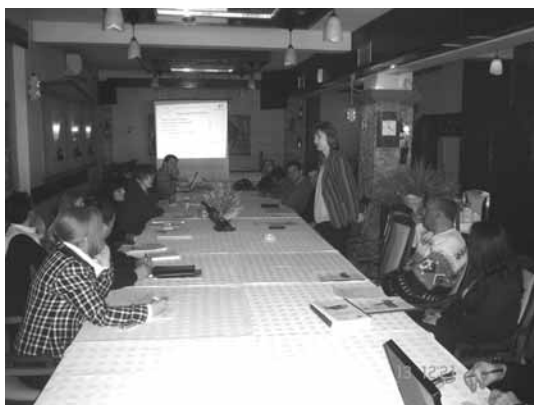
Од регионалната средба одржана во Куманово

Стратегијата ќе биде подготвена во наредна фаза во месец септември 2008. Се планира одржување на неколку округли маси со цел доближување на стратешките определби на овој документ до јавноста и општествените чинители, пред тој да се достави до Владата на усвојување.