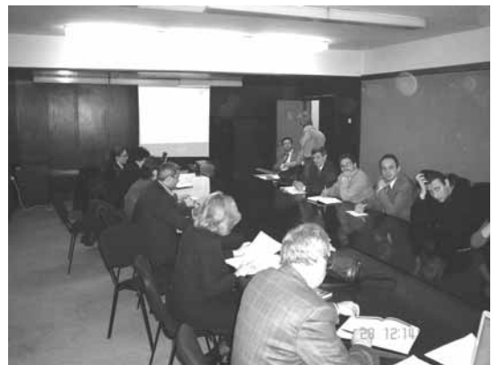
Од регионалната средба одржана во Штип

недоволно комуницираат со општините. Од друга страна, локално идентифицираните проекти се секогаш резултат на недоволно стручно водено локално планирање, така што истите се наменети за решавање на помални горливи проблеми и многу ретко се применува пристапот за фазно решавање на глобални проблеми во животната средина. Исто така соработката помеѓу општините со цел дефинирање на поголеми регионални проекти е отежната од низа субјективни и објективни причини.