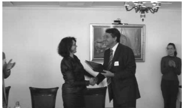
Потпишување на договорот со градоначалникот на општина Валандово

Првиот семинар “Почейни активности за изработка на ЛЕАП” се одржа во хотелот “Инекс Горица” во Охрид, од 06 - 09 Мај 2008 год. На семинарот присуствуваа по 6 претставници од селектираните општини. Семинарот беше искористен за запознавање на претставниците на општините со активностите кои секоја општина треба да ги превземе заради започнување на изработката на ЛЕАП. При тоа беа дискутирани следните теми: Формирање на организациска структура за