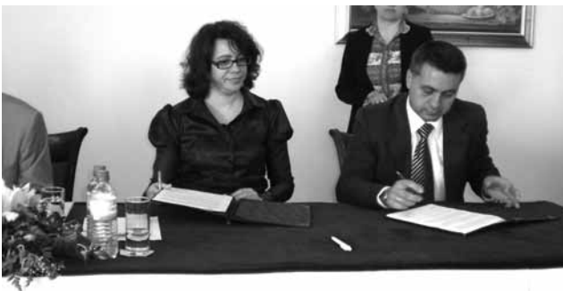
Потпишување на договорот со градоначалникот на општина Чашка