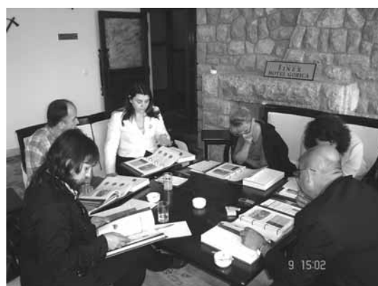
Презентација на учебникот

За сите дополнителни информации во врска со проектот можете да се обратите во Канцеларијата на РЕЦ во Македонија или во Канцеларијата за комуникација со јавност при Министерството за животна средина и просторно планирање.