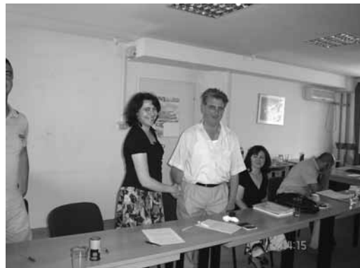
Потпишување на договор