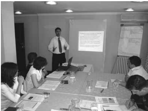
Тема: надгледување на власта