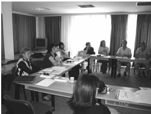
Состанок на “победниците”