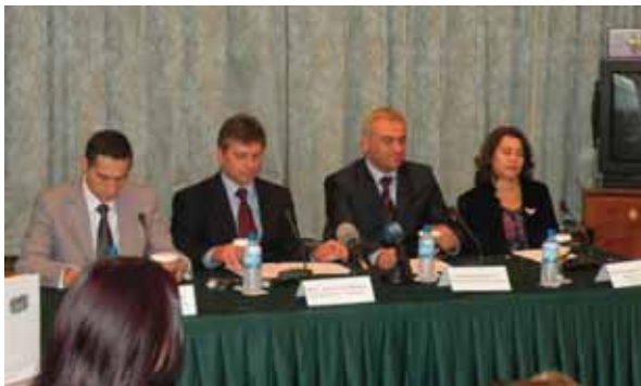
Појдигнување на договорите за соработка

Целта на Зелениот пакет јуниор е да придонесе кон подобар квалитет на животната средина во Македонија, преку поттикнување на личната одговорност на граѓаните за подобрување на сопствениот однос и поголема грижа за животната средина. Зелениот пакет јуниор, слично на неговиот претходник, ќе осмисли активни методи и алатки за едукација на најмладите ученици (на возраст од 6-10 години), нивните наставници и родители.