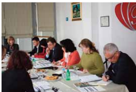
Работилница одржана во Црна Гора

- Во Србија рафинеријата не набавува оловен адитив и откако ќе ги потроши залихите ќе се создадат услови за отстранување на оловниот бензин. Се претпоставува дека во 2011г. во Србија оловниот бензин ќе биде отстранет. Од друга страна, Министерството за енергетика и рударство, со договорот за приватизација е обврзано да почeka со измената на правилникот за квалитет на горивата додека рафинеријата не е подготвена со својот произведен програм да ги исполнува новите стандарди. Работната група во Србија ќе има улога да ги координира овие активности и да го забрза процесот на изработка на соодветниот правилник со цел отстранувањето на оловниот бензин да се усогласи, како во смисла на производството, така и во поглед на регулативата.