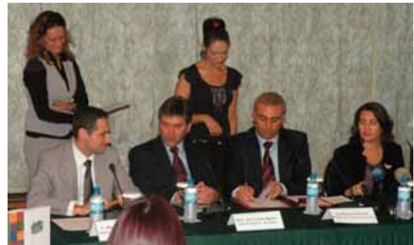
Појдигнување на договорите за соработка

Во октомври 2009г. поширока работна група составена од наставници, едукатори, советници од Бирото за развој на образованието на Р. Македонија започна со работа на текстовите од Прирачникот за наставници. Зелениот пакет јуниор како и Зелениот пакет ќе се адаптира и за потребите на децата со оштетен вид па во активностите на проектот уште од самиот почеток учествуваат и претставници од Училиштето за деца и младинци со оштетен вид Димитар Влахов од Скопје.