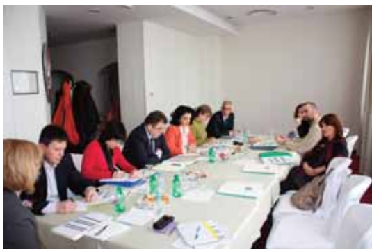
Работилница одржана во Црна Гора

Искуствата од Македонија поврзани со отстранувањето на оловниот бензин и подобрувањето на квалитетот на горивата воопшто, се споделуваат со земјите во регионот: Босна и Херцеговина, Црна Гора и Србија. За таа цел се воспоставија работни групи во овие земји кои ќе извршат анализа на следните области: