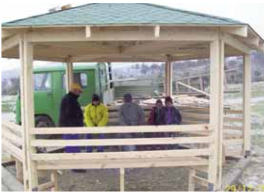
Изградба на настрешница

Целта на овој проект е расчистување на дивата депонија во општина Кочани која се наоѓа на неколку метри пред фабриката за вода. Просторот под самата фабрика се планира да се претвори во зелена површина, која жителите од овој дел на градот ќе можат да ја користат за одмор, а од спротивната страна планирано е поставување на реквизити за игра и разонода на најмладата популација, односно пренамена на просторот во детски забавен парк. Здружението на граѓани Роми досега имаше неколку активности. Пред се имаа презентација пред општествените чинители и партнерите, а потоа агитирање меѓу населението и на крај расчистување на просторот.