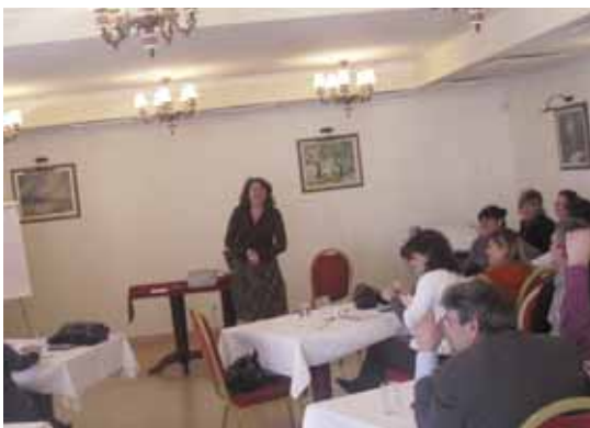
Охрид, втор семинар

На овој семинар, како и на сите останати учествуваа претставници на општините - добит-