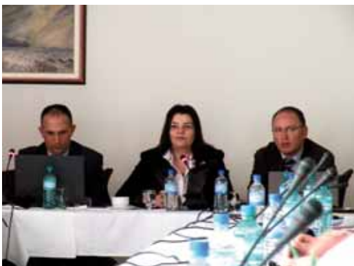
Факулитатори на работилницата

Содржината на дневниот ред беше разновидна и во најголем дел посветена на потребата од регионално управување со отпадот. Освен објаснувањето на стратешката и правната рамка и потребите од инвестиции во овој сектор, многу голем дел од времето беше посветен на регионалната соработка. При тоа предавачи од Летонија ги пренесуваа своите искуства од земја која е по многу нешта слична на Македонија. Исто така, голем дел од сесиите беше посветен и на барањата за изработка на општинските планови за управување со отпад, како и на инвестициите во овој сектор. За таа цел претставници на канцеларијата на Светската банка во Скопје, на канцеларијата за претпристапни фондови ИПА при Приоритетни инвестиции во областа на животната средина и претставник на Министерството за финансии беа поканети да ги објаснат можностите за финансирање на капитални проекти во кои спаѓа и изградбата на регионални депонии.