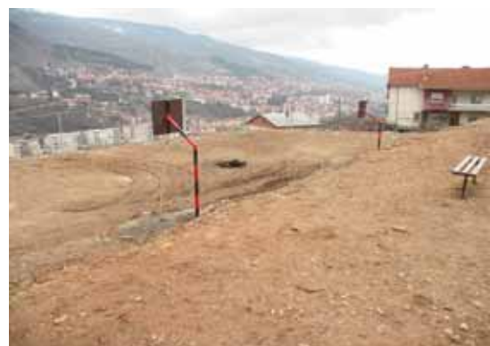
Поставување на реквизити за спорт и рекреација