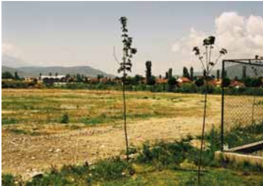
Пред почетокот на уредувањето

Овој проект за свој главен проблем го има недоволниот број на зелени површини во урбаните делови на градот Скопје, а целта на проектот е унапредување на животните услови во урбаните