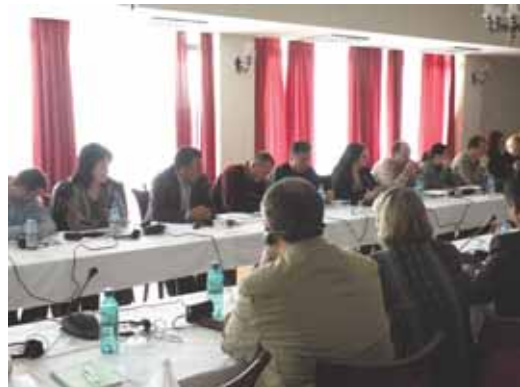
Учесници на работилницата

Содржината на дневниот ред беше разновидна и во најголем дел посветена на потребата од регионално управување со отпадот. Освен објаснувањето на стратешката и правната рамка и потребите од инвестиции во овој сектор, многу голем дел од времето беше посветен на регионалната соработка. При тоа предавачи од Летонија ги пренесуваа своите искуства од земја која е по многу нешта слична на Македонија. Исто така, голем дел од сесиите беше посветен и на барањата за изработка на општинските планови за управување со отпад, како и на инвестициите во овој сектор. За таа цел претставници на канцеларијата на Светската банка во Скопје, на канцеларијата за претпристапни фондови ИПА при Приоритетни инвестиции во областа на животната средина и претставник на Министерството за финансии беа поканети да ги објаснат можностите за финансирање на капитални проекти во кои спаѓа и изградбата на регионални депонии.