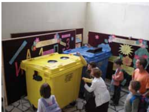
Поставување на контејнери во основните и средните училишта

Во рамките на овој проект меѓу 26 и 28 септември 2008 година, во Извидничкиот дом Орел во с. Орел се одржа еко - камп, како дел од проектните активности на проектот во партнерство со ОЖ Свети Николе, локалната самоуправа и останатите чинители: Граѓанска иницијатива на жени, Здружение на роми, Здружение на власи и Еколошко друштво Изгрев. На еко - кампот