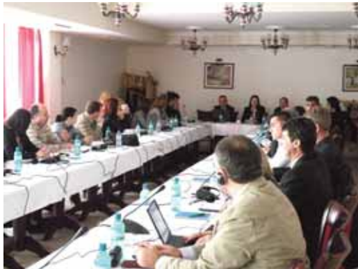
Учесници на работилницата

Во рамките на проектот “Приоритетни инвестиции во областа на животната средина” на 27 и 28 октомври во хотел „Индекс Горица” во Охрид се одржа дводневна национална работилница на тема “Развој на инфраструктурни проекти за животна средина” во делот на отпад во Р.Македонија. Целна група на националната работилница беа претставници на локални самоуправи и на јавни комунални претпријатија од околу дваесетина општини во Македонија.