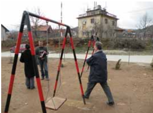
Поставување на детски реквизити

Проектот придонесува кон можно решавање на проблемите со дивите депонии во градските средини. Имено, овие површини најчесто се користени за неконтролирано одлагање на секаков вид на отпад од страна на месното население а со тоа се уништуваат јавните површини кои