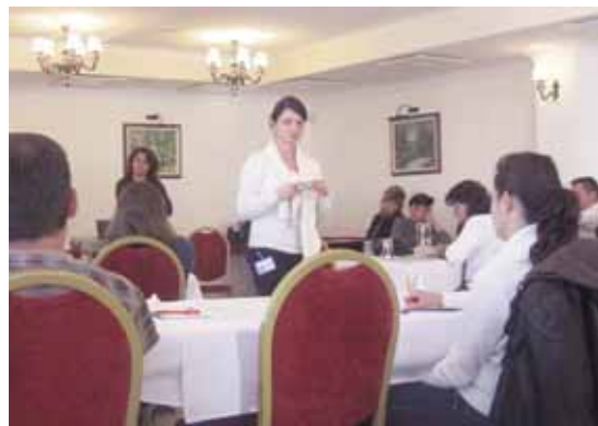
Охрид, втор семинар

ници на финансиска поддршка за развивање на ЛЕАПи.