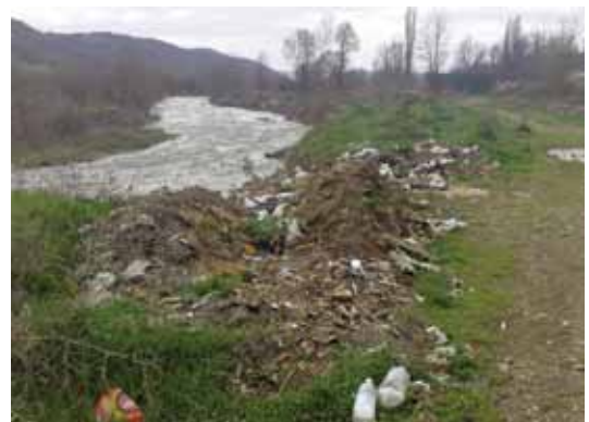
Јаловиште, рудник Злетово

искуство во собирање отпад од руралните средини, економските ефекти од овие активности како и состојбата со одлуките за управување со отпад на локално ниво.