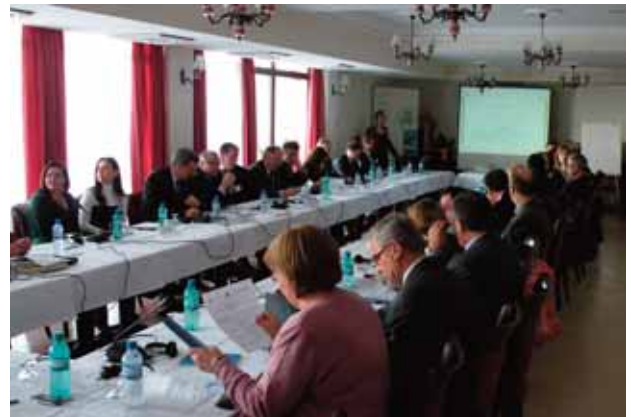
Учесници на работилницата во Охрид

Исто така претставниците на министерствата за животна средина од земјите имаа можност да разменат искуства, како во однос на процесите за усогласување со Европските директиви во