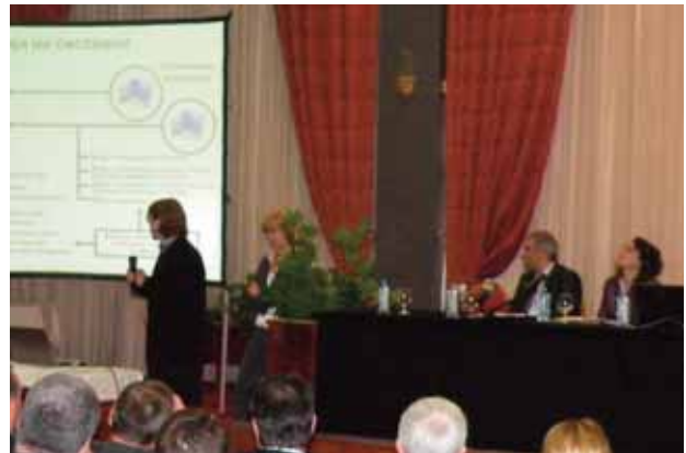
Претставување на базата на податоци

РЕЦ и Форнет ја претставија пред присутните генезата на Дататазата, проблемите со кои се соочуваат општините при прибирањето на податоци за животната средина, потенцијалите на алатката при спроведувањето на законите и подзаконските акти што ја регулираат сферата на животната средина. Исто така, беше претставена методологијата, организацијата и структурата на системот, администраторскиот интерфејс и неговите модули, корисничкиот интерфејс и неговите модули, а беа дадени и практични примери за тоа како функционира апликацијата.