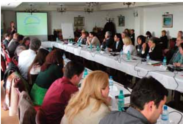
Регионална работилница за чисти горива и возила

На работилницата се истакна дека во само 14 земји во светот (Авганистан, Алжир, Ирак, Манмар, Северна Кореа, Палестина, Таџикистан, Тунис, Узбекистан, Јемен, Србија, Црна Гора, Федерацијата на Босна и Херцеговина и Македонија) сеуште се употребува оловниот бензин. Партнерството за чисти горива и возила, како и Владите на овие земји прават напори ова гориво кое предизвикува штетни емисии што предизвикуваат здравствени проблеми кај населението (особено децата и бремените жени) да биде отстрането во блиска иднина. Во Македонија се очекува резервите на оловниот бензин да се потрошат до јуни 2009 г. во Црна Гора предвидено е периодот на исфрлање да трае до јули 2009 г. додека во Србија и Б иХ се очекува овој период да потрае до 2010-201 година.