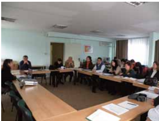
Презентација на проектните активности и меѓусебно запознавање на ГЗ