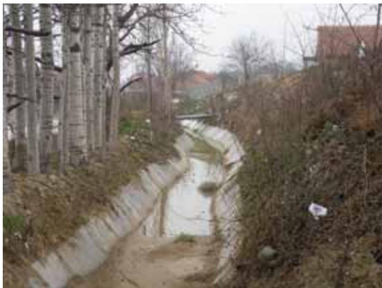
Одводен канал во с. Кондово

ЕМАГ го оддржа четиринаесеттиот квартален состанок за проектот Скопска Обиколница. Групата ги разработува прашањата кои произлегуваат за време на мониторингот на животната средина на изградбата на обиколницата. Советодавната Група за Животна Средина и Мониторинг за Скопската Обиколница (ЕМАГ) го одржа својот четиринаесетти квартален состанок и инспекција на терен на ден 4 март 2009 год. ЕМАГ го проценува спроведувањето и ефикасноста на мерките за намалување на влијанието врз животната средина и мониторингот од изградбата на западната секција од проектот Скопска Обиколница Фаза 2, финансиран од Европската Банка за Обнова и Развој