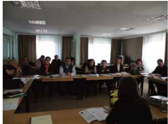
Претставување на формуларите за финансиски и описен извештај