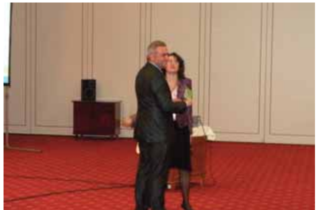
Директорката на РЕЦ официјално му ја пре- дава Датта-базата на министерот