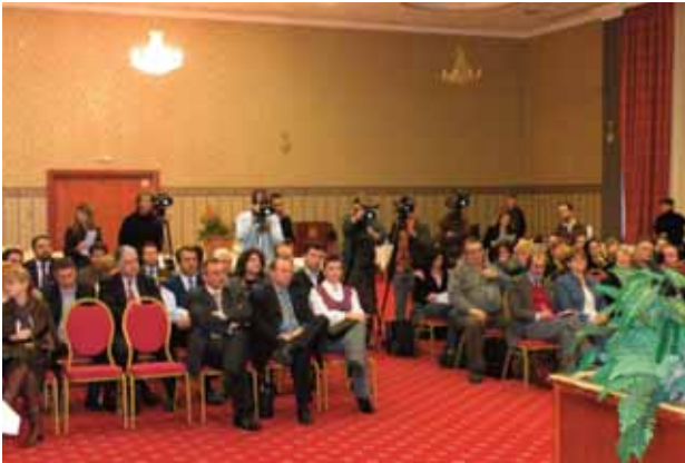
Претставување на базата на податоци

Во изработката на Дататазата беше вклучена фирмата Форнет, која што беше поканета да ги презентира алатките, функциите и можностите на дататазата.