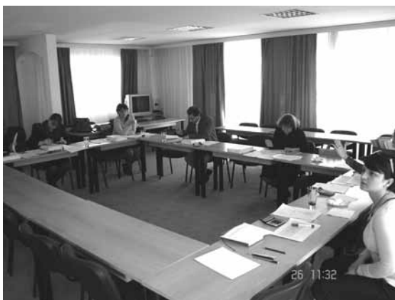
Состанок на локалниот советодавен одбор

Составот на членовите на Локалниот Советодавен Одбор е балансиран во смисла на географска дистрибуција, експертиза, едукативна и професионална основа. Дополнително, во овој проект, во процесот на селекција, учествуваше и претставник од Министерството за животна средина и просторно планирање како полноправен член на Локалниот Советодавен Одбор. Претседавач на ЛСО е Директорот на Канцеларијата на РЕЦ во Македонија. Исто така претставник од Sida, како набљудувач, учествуваше во процесот на селектирање на шесте општини.