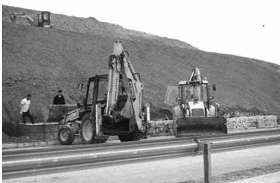
Градежна механизација при изградба на обиколницата

За повеќе информации, можете да ја контактирате Канцеларијата на РЕЦЈ во Македонија, или да ја посетите веб страната: www.rec.org.mk , која ги содржи сите записници од состаноците и посетите на терен.