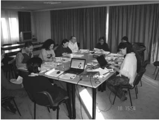
Обука на тренерите

Истовремено со повикот за ГЗ беше објавен и повикот за тренери/фаџилитатори. На овој повик се пријавија вкупно 8 лица. По процесот на селекција, РЕЦ обучи 6 локални фаџилитатори за користење на алатката за самооценување како и бизнис планирање, кои потоа ќе бидат во можност да им помагаат на ГЗ во сите фази на процесот.