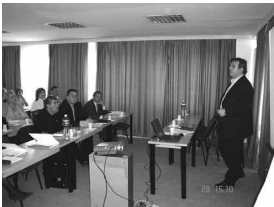
Обука за инспектори од Државниот Здравствен и санитарен инспекторат

Првата обука се одржа во термин 26-28 ноември, втората 17-19 декември, 2007 година, а третата 5-7 февруари, 2008 година. Четвртата обука беше дополнително организирана за вработените во Републичкиот санитарен инспекторат,