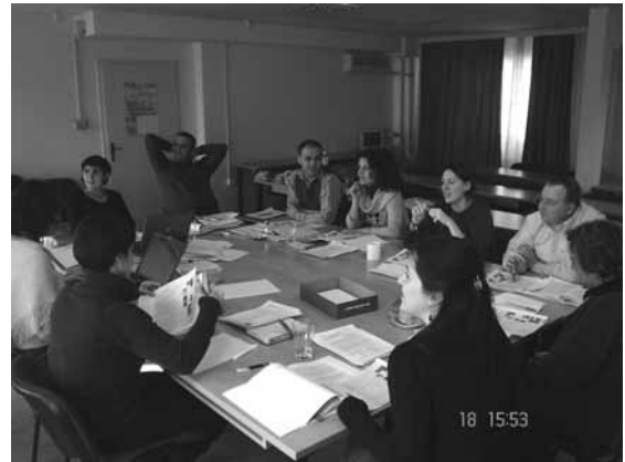
Користење на алатките за самооценување

Фаза на самооценување: Секое избрано ГЗ ќе мине низ процесот на самооценување по пат на дискусија која ќе се одвива во рамките на една работилница со помош на фаџилитаторите обучени од страна на РЕЦ. Оваа фаза може да трае од неколку часа до неколку денови во зависност од капацитетот на ГЗ да ги заврши сите фази од самооценувањето и ќе се одвива во просториите на ГЗ.